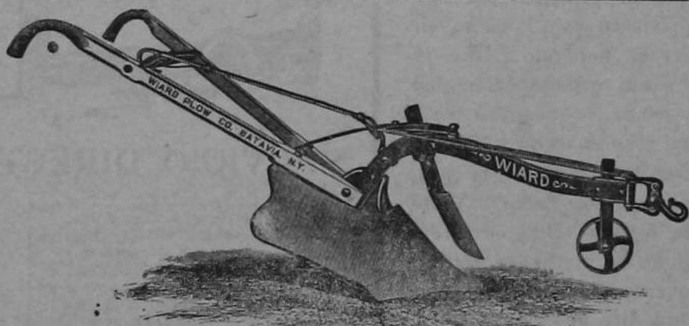
INODOROS AMERICANOS tanque alto y tanque bajo

Materia para Cloacas Tubos, codos, sifones, tees, "Y" etc., todo de fabricación belga